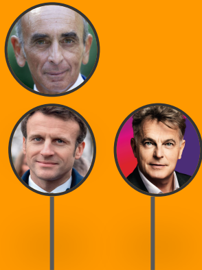
Roussel Macron Zemmour