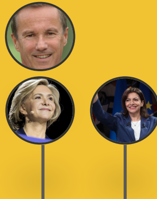
Hidalgo Dupont-Aignan Pecresse