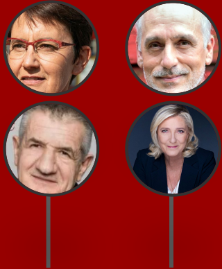
Arthaud Poutou Lasalle Le Pen